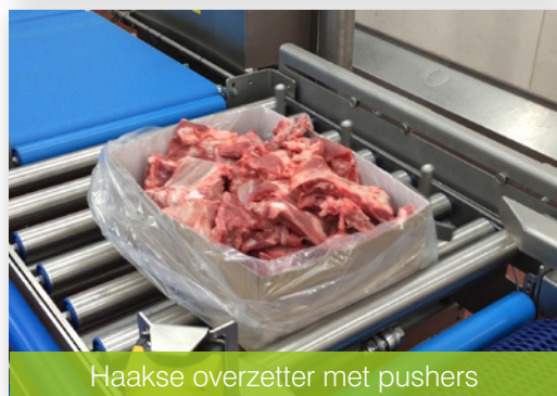
Haakse overzetter met pushers