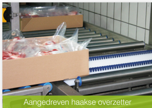
Aangedreven haakse overzetter