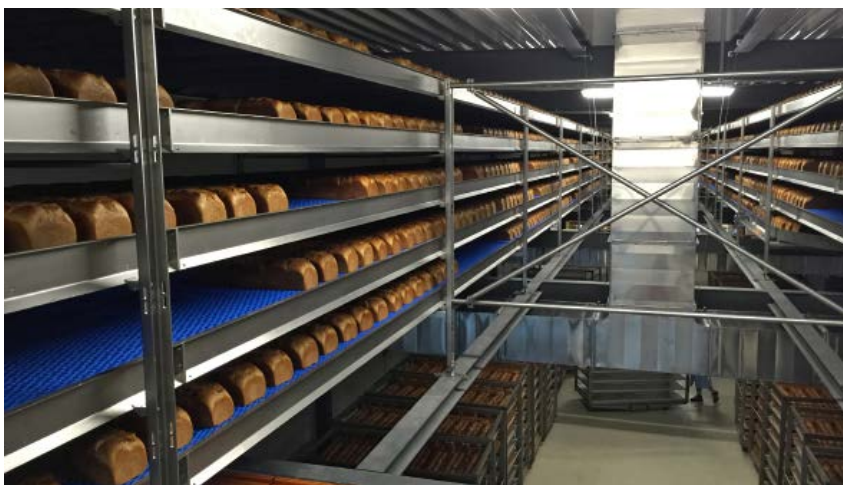
De modulaire schakelband maakt het mogelijk om recht-, bocht- en opvoertransport in één systeem te combineren, zodat kwetsbare producten niet beschadigd raken door bandovergangen.

Marvu levert transportbanden voor alle type voedselverwerkende bedrijven, zoals bakkerijen, vleesverwerkende bedrijven en agf-bedrijven. 'Voor elke doelgroep is weer een andere transportoplossing van toepassing', vervolgt Karin van Wanrooij. 'Bij bakkerijen is het bijvoorbeeld belangrijk dat de producten niet aan de transportband kleven én dat de producten voldoende tijd hebben om te rijzen en af te koelen. Banketbakkerijen werken veelal met kleine, kwetsbare producten en daarom is het daarbij belangrijk dat er een soepele bandovergang is, zodat de producten niet beschadigen. Zo heeft elke bedrijfstak en bedrijfsomgeving een ander type transportband en een andere oplossing nodig. Aan ons de uitdaging om daar continu in mee te denken: nu en in de toekomst.'●