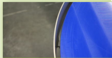
Edelstahlseitenführung fest am Untergestell

Abweichende Maße auf Anfrage, mailen Sie an sales@marvu.nl .