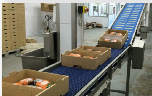
Flush grid met friction top